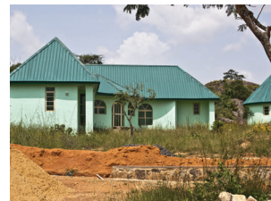
Principalele clădiri ale centului de refacere post-traumatic